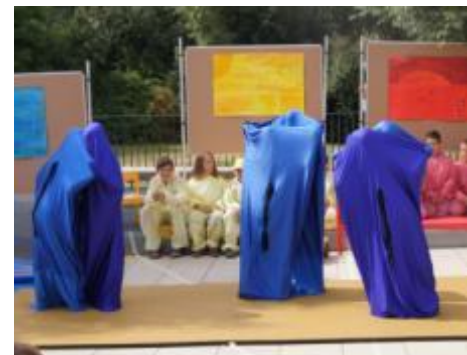
Ein Highlight: Die Tangotänzer in blauen Tanssäcken

Unsere Schulabgänger hatten sich schon lange auf diesen Tag vorbereitet und abwechslungsreiches Programm bzw. ein richtiges Musical einstudiert, um ihren Abschluss zu feiern. Schließlich haben sie eine ganz wichtige Etappe in ihrer Schullaufbahn erfolgreich gemeistert – die Grundschulzeit.