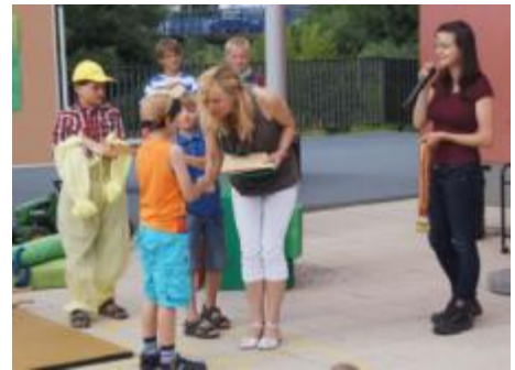
Auszeichnung: Einige Go-Spieler haben an den deutschen Meisterschaften teilgenommen!

Eine kleine Tradition ist es mittlerweile, dass die verabschiedeten 4.Klässler einen bunten Händeabdruck hinterlassen. Frau Eberhardt und die 4a hatten dafür dieses Jahr einen ganz besonderen "Untergrund" gewählt: einen Baumstamm. Dieser schmückt nun erst einmal unseren Schulhof - solange bis er einen würdigen Platz zur ewigen Erinnerung gefunden hat.