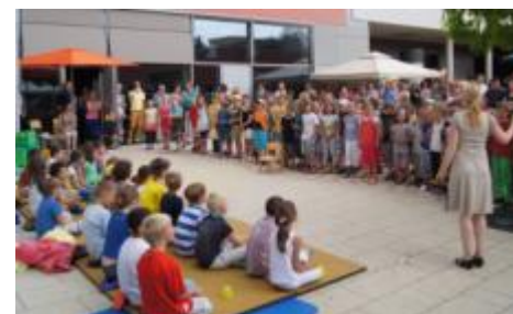
Gänsehaut: Unsere vierten Klassen bekommen ihr Abschiedsständchen „Auf und davon“

Nach dem Programm kam ein besonderer Moment. Alle Schüler der Schule erhoben sich, um für unsere vierten Klassen das Abschiedslied „Auf und davon“ zu singen. Das hatten sich unsere „Großen“ auch gewünscht. Spätestens jetzt kullerten zahlreiche Tränen. Doch wir entlassen euch nun voller Stolz in die fünfte Klasse.