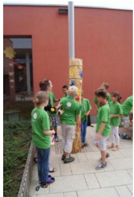
Abschiedsgeschenk: Die Klasse 4a enthüllt ihr Kunstwerk.