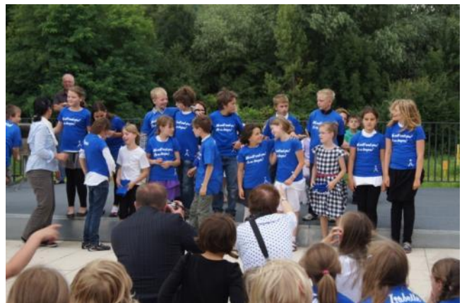
Good bye class 4a!