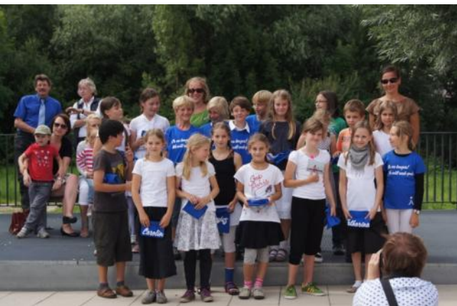
Au revoir la classe 4b!

Anschließend konnten wir uns am Kuchenbüffet stärken, welches unsere Eltern liebevoll vorbereitet hatten. Am späteren Abend kam dann doch noch der befürchtete Regenschauer, doch das hielt uns nicht davon ab den Grill anzuwerfen. Es war ein toller Nachmittag. Wir danken allen Eltern für die Unterstützung!